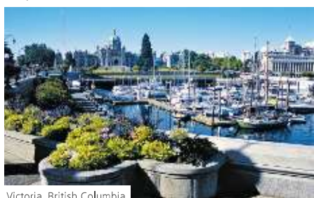
Victoria, British Columbia