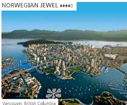
Vancouver, British Columbia