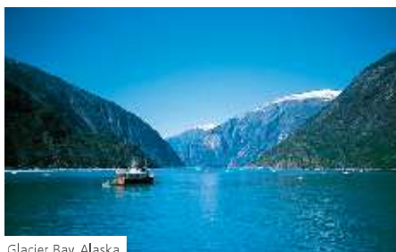
Glacier Bay, Alaska